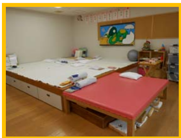
リハビリスペース