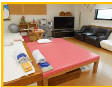
リハビリスペース