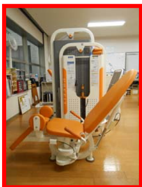
トレーニングマシン (ヒップアブダクション)

要介護：個別リハビリ 20分～60分（退院後 1～3 か月以内は最大 60分）、マシントレーニング、エアロバイク