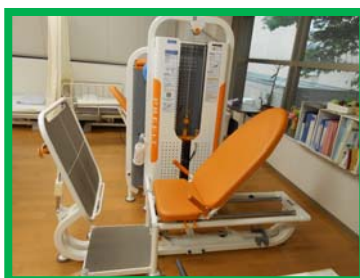
トレーニングマシン (レッグプレス)